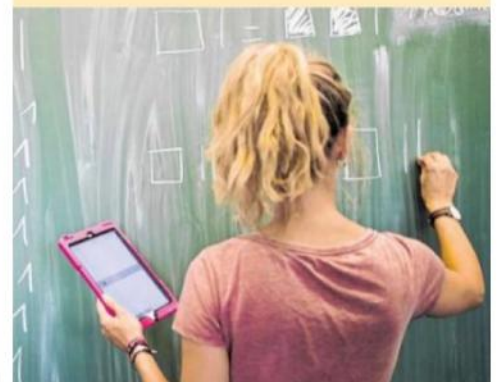
Welche weiterführende Schule hat welche Angebote? Auf dieser Seite und der folgenden Seite finden Sie alles im Überblick.